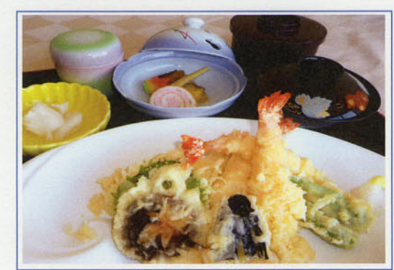
天ぷら御膳 ¥1,300 (税込 ¥1,430)