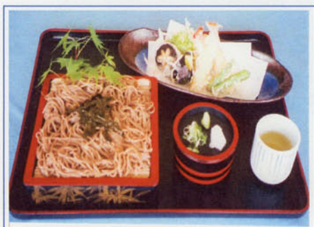
天ざるそば(うどん)セット ¥1,000 (税込¥1,100)