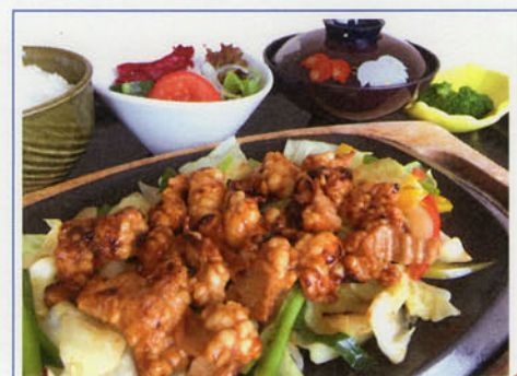
牛ホルモン鉄板焼きセット ¥1,300 (税込¥1,430)