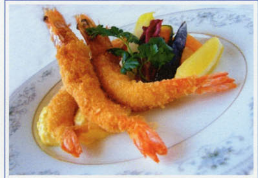
エビフライセット ¥1,300 (税込¥1,430)