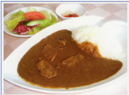
国産ビーフカレー ¥1,100 (税込¥1,210)