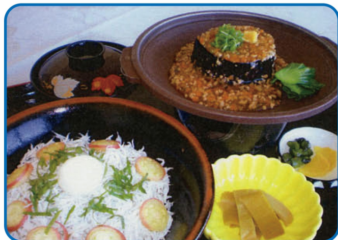
釜揚げちりめん丼 米なすセット ¥1,300(税込 ¥1,430)