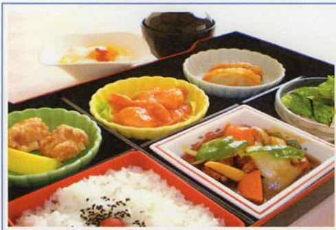
中華弁当 ¥1,300 (税込¥1,430)