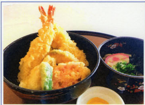
天丼セット ¥1,100 (税込 ¥1,210)