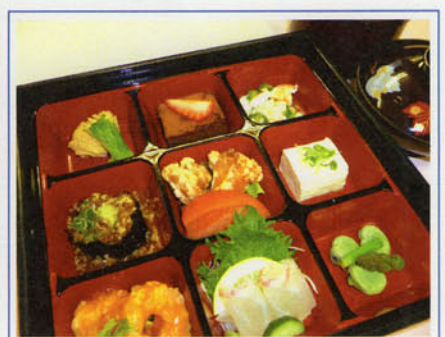
ままごと弁当(日替) ¥1,100 (税込 ¥1,210)