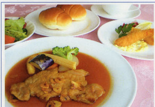
高知県産ポークステーキとエビフライセット ¥1,600 (税込¥1,760)

チキンステーキクリームソース、タコサラダ、 スープ、ライスorパン、デザート ※デザートは内容が変わります