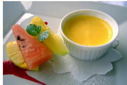
プリン ¥450(税込 ¥495)