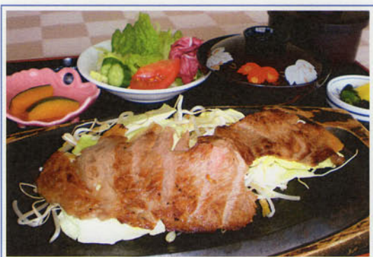
焼肉御膳 ¥2,300 (税込¥2,530)