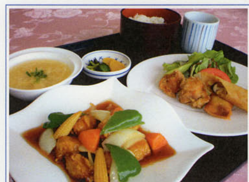
酢豚セット ¥1,200 (税込¥1,320)