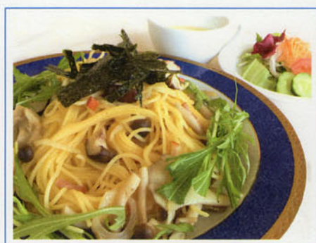
シーフード和風スパ ¥1,000(税込¥1,100)