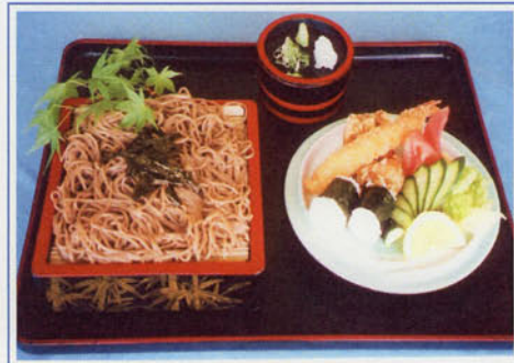
ざるそば(うどん)セット ¥1,000 (税込¥1,100)