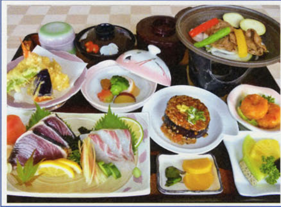
たまい御膳 ¥3,000 (税込 ¥3,300)