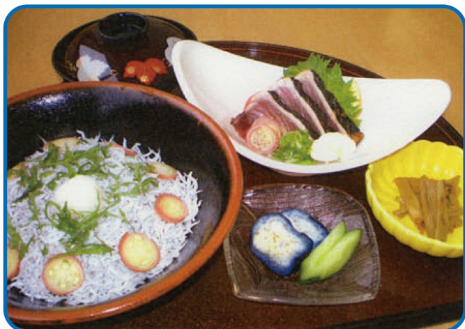
釜揚げちりめん丼 たたきセット ¥1,400(税込 ¥1,540)

あったかご飯にたっぷりの釜揚げちりめん じゃこをのせて、ほのかな柚子の香りと、 安芸市名産「みょうが」、大葉、 大根おろしを薬味にそえました。