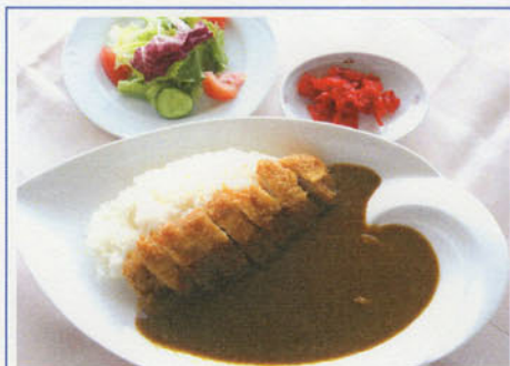
ポークカツカレー ¥1,100 (税込¥1,210)