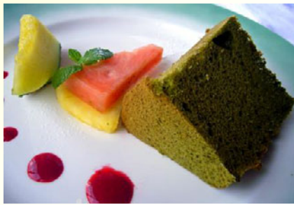
抹茶シフォンケーキ ¥500(税込 ¥550)