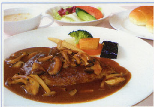
ハンバーグセット ¥1,400 (税込¥1,540)