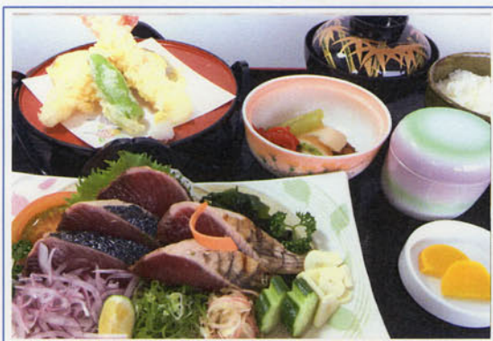
タタキ御膳 ¥1,800 (税込 ¥1,980)