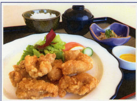
唐揚げセット ¥1,200 (税込¥1,320)