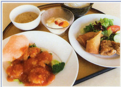
エビチリセット ¥1,200 (税込¥1,320)