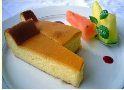
バイクドチーズケーキ ¥500(税込 ¥550)