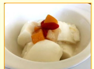
杏仁豆腐 ¥400(税込 ¥440)