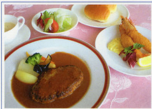
ハンバーグとエビフライセット ¥1,400 (税込¥1,540)