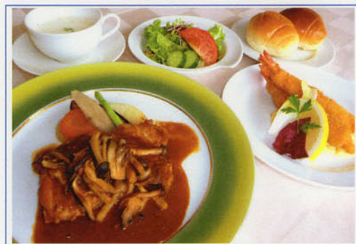
チキンステーキきのこソースとエビフライセット ¥1,500 (税込¥1,650)