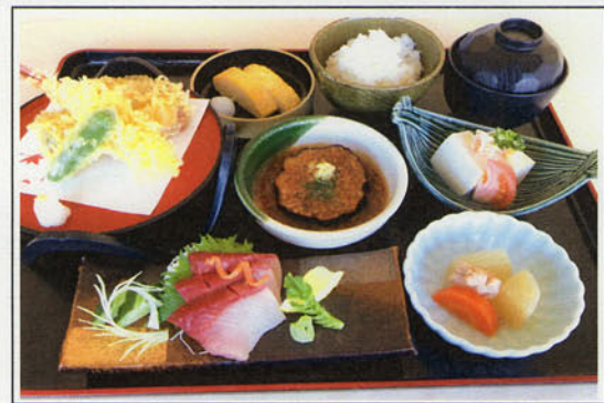
シルバー御膳 ¥1,500 (税込 ¥1,650)

刺身、天ぷら、米茄子そぼろあんかけ、小鉢、冷奴、だし巻、茶碗蒸し、吸物、香物、ご飯