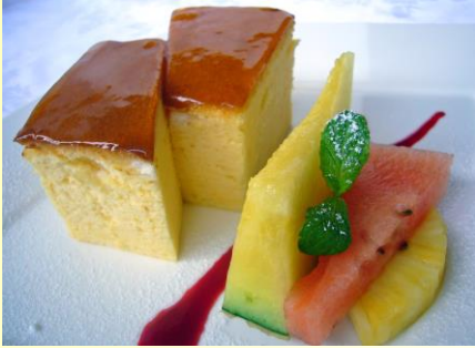
チーズケーキ ¥500(税込 ¥550)