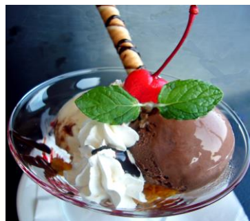
チョコレートパフェ ¥500(税込 ¥550)