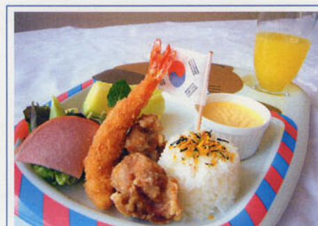
お子様ランチ ¥700 (税込¥770)