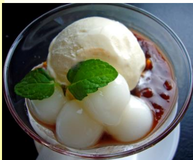
クリームぜんざい ¥500(税込 ¥550)