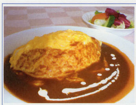
オムライス ¥1,000 (税込¥1,100)