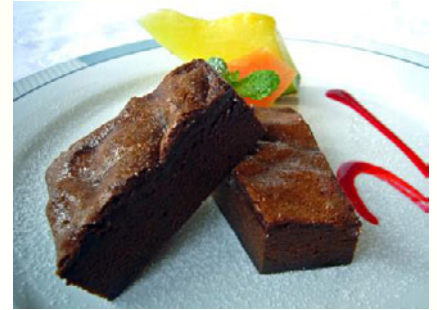
チョコレートケーキ ¥500(税込 ¥550)