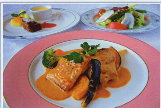
レディースセット ¥1,500 (税込¥1,650)

チキンステーキクリームソース、タコサラダ、 スープ、ライスorパン、デザート ※デザートは内容が変わります