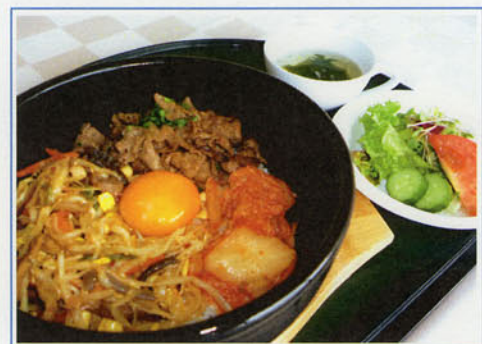
牛焼肉石焼ビビンバセット ¥1,200 (税込1,320)