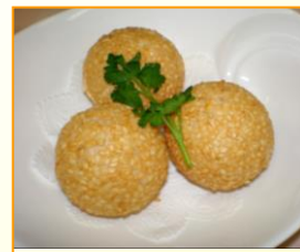
ゴマ団子 ¥300(税込 ¥330)