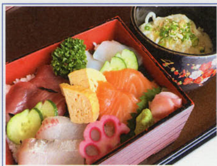
海鮮丼 ¥1,400 (税込 ¥1,540)