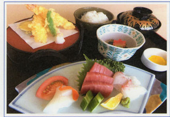
刺身御膳 ¥1,800 (税込 ¥1,980)