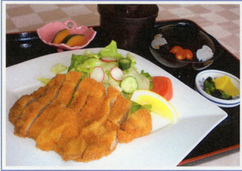
高知県産とんかつセット ¥1,200 (税込¥1,320)