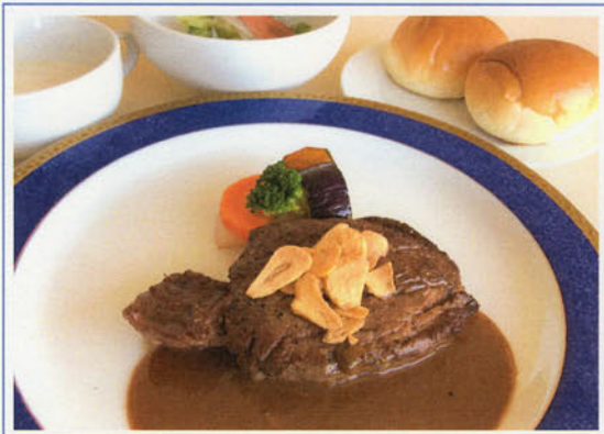
国産フィレステーキセット ¥2,800 (税込¥3,080)

◆スープ、サラダ、ライスorパン付 ◎ソースは、きのこ・和風・ガーリックよりお選びください。