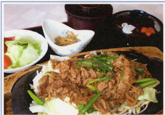
スタミナ御膳 ¥1,600(税込¥1,760)

◆スープ、サラダ、ライスorパン付 ◎ソースは、きのこ・和風・ガーリックよりお選びください。