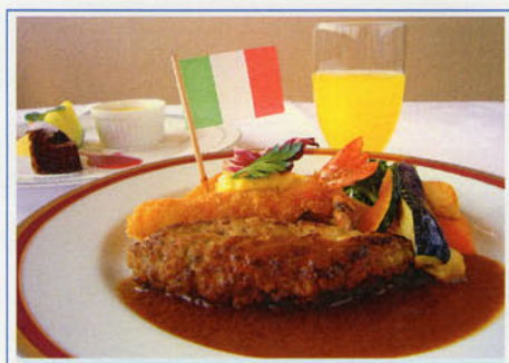
お子様ハンバーグ&エビフライセット ¥1,100 (税込¥1,210)