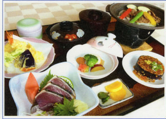
あき御膳 ¥2,000 (税込 ¥2,200)